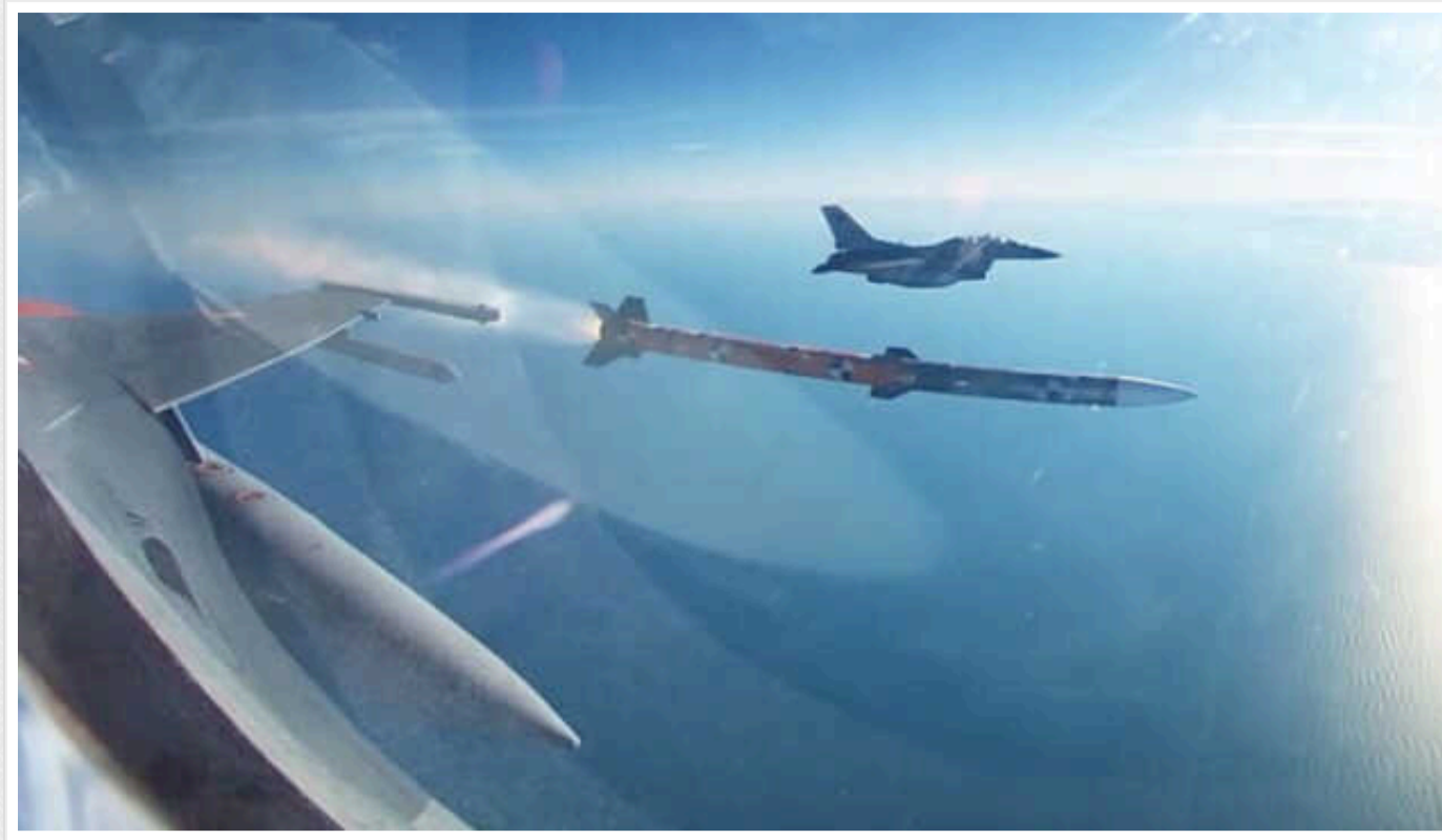
В Туреччині завершують випробування ракет "повітря-повітря" власного виробництва

У Туреччині завершилися конструкційні випробування двох ракет власної розробки класу "повітря-повітря" – Gökdoğan та Vozdoğan. Ракети будуть готові до передачі у ВПС Туреччини після випробування їхньої дії з боєвим боєзапасом.