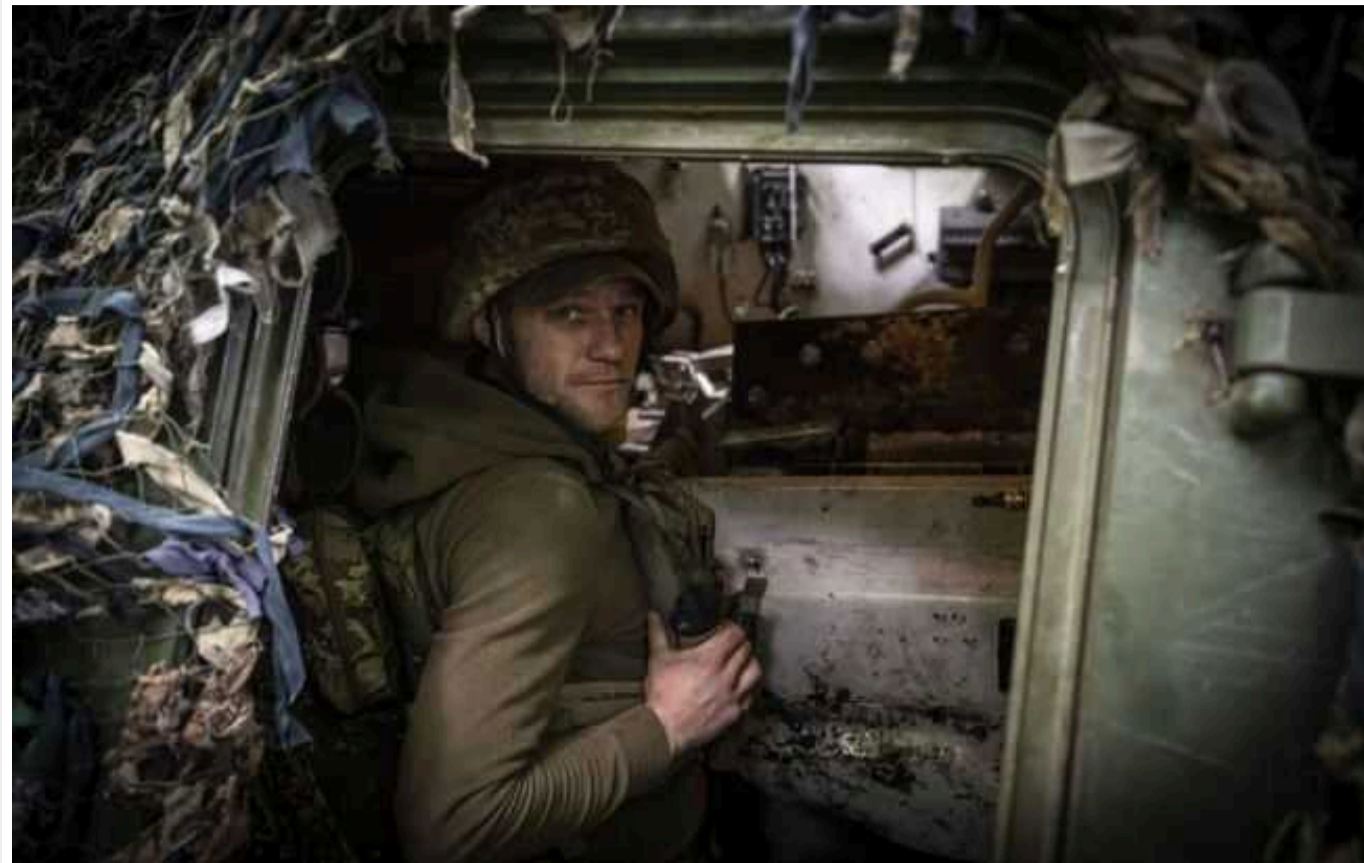
Експерти ISW пояснили, як погода та морози змінять бойові дії в Україні

Стиїкі морози в Україні, ймовірно, ускладнять операції на фронті, але можуть створити сприятливіший ґрунт для механізованих маневрених бойових дій, оскільки найближчими тижнями земля сильно промерзне.