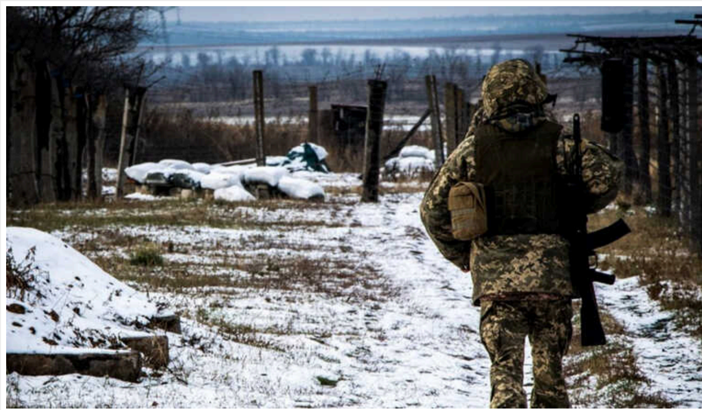
Ситуація на фронті: протягом минулої доби відбулося 64 бойових зіткнення, ворог завдав 3 авіаційних удари

Українські військові відбили 13 атак противника на Мар'їнському напрямку, розширюють плацдарм на Херсонському напрямку. Підрозділи ракетних військ уразили 2 райони зосередження особового складу противника.