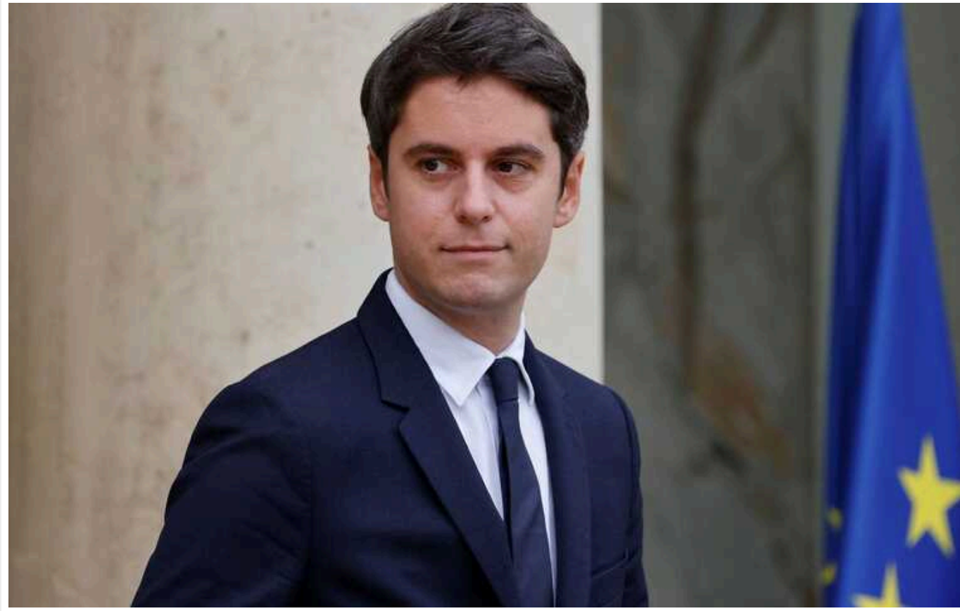
У Франції оновили склад уряду

У Франції вчора, 11 січня, оновили склад уряду Габрієля Аттала. Зміни торкнулися, зокрема, Міністерства закордонних справ, яке тепер очолив Стефан Сежурне замість Катрін Колонні.