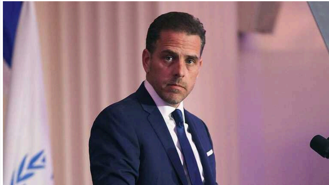
Син президента Байдена не погодився із звинуваченнями у несплаті податків

У федеральному суді в четвер сину президента США Хантеру Байдену були пред'явлені звинувачення в несплаті податків. Він не визнав себе винним.