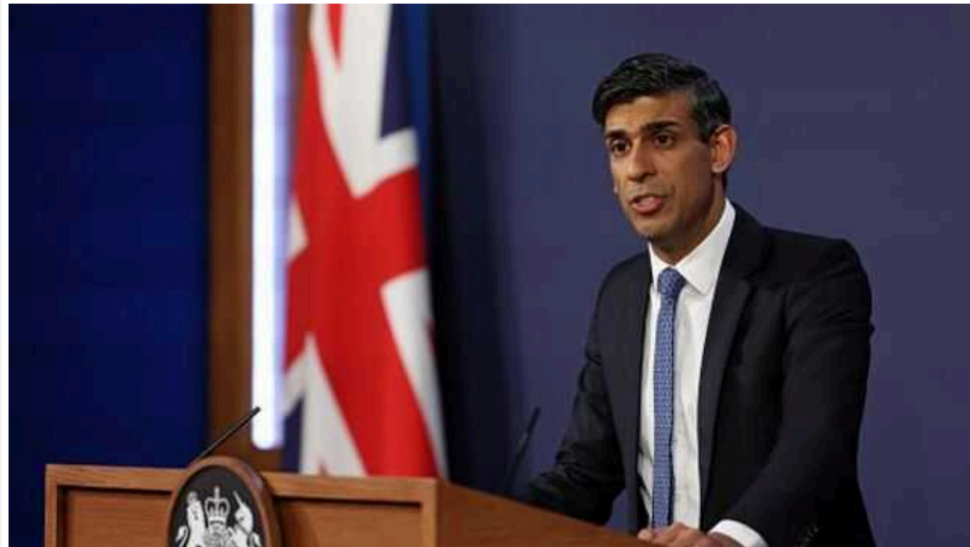
Прем'єр Британії Сунак підтвердив авіаудари по єменських хуситах

Військово-повітряні сили Великої Британії, спільно зі США, за підтримки Нідерландів, Канади та Бахреїну, завдали точкових ударів по військових об'єктах, що використовуються повстанцями-хуситами в Ємені.