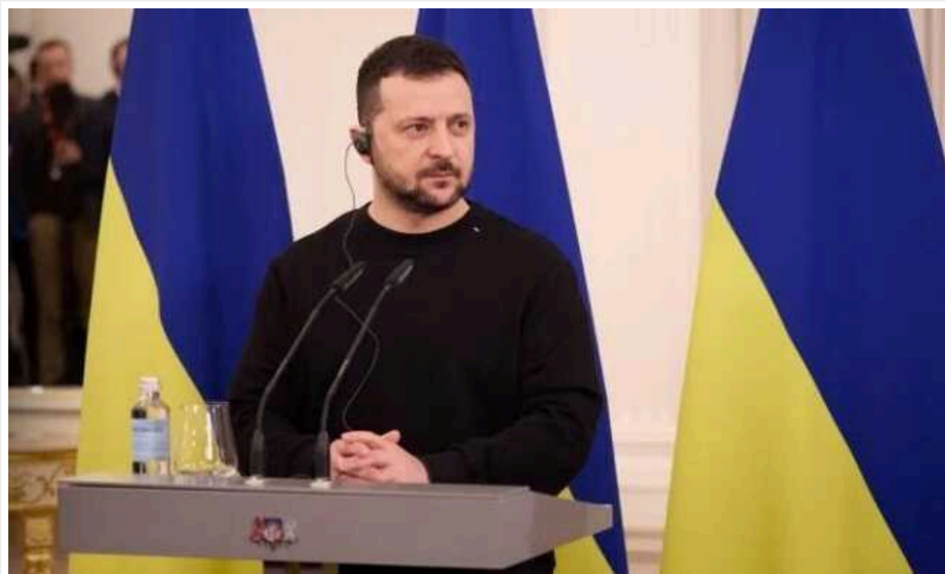
Зеленський – про відсутність кроків на фронті: "Ми спробували, і це спрацювало"

Президент України Володимир Зеленський назвав причину, через яку Україна не може здійснювати широкі дії на фронті і що цьому заважає.