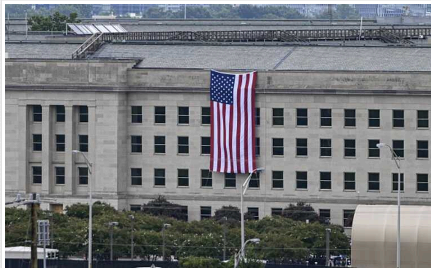
У Пентагоні заявляють, що недостатньо контролювали передачу Україні військову допомогу

У Міноборони США випустила доповідь, в якій заявляється, що військова допомога Україні погано відстежувалася та контролювалася.