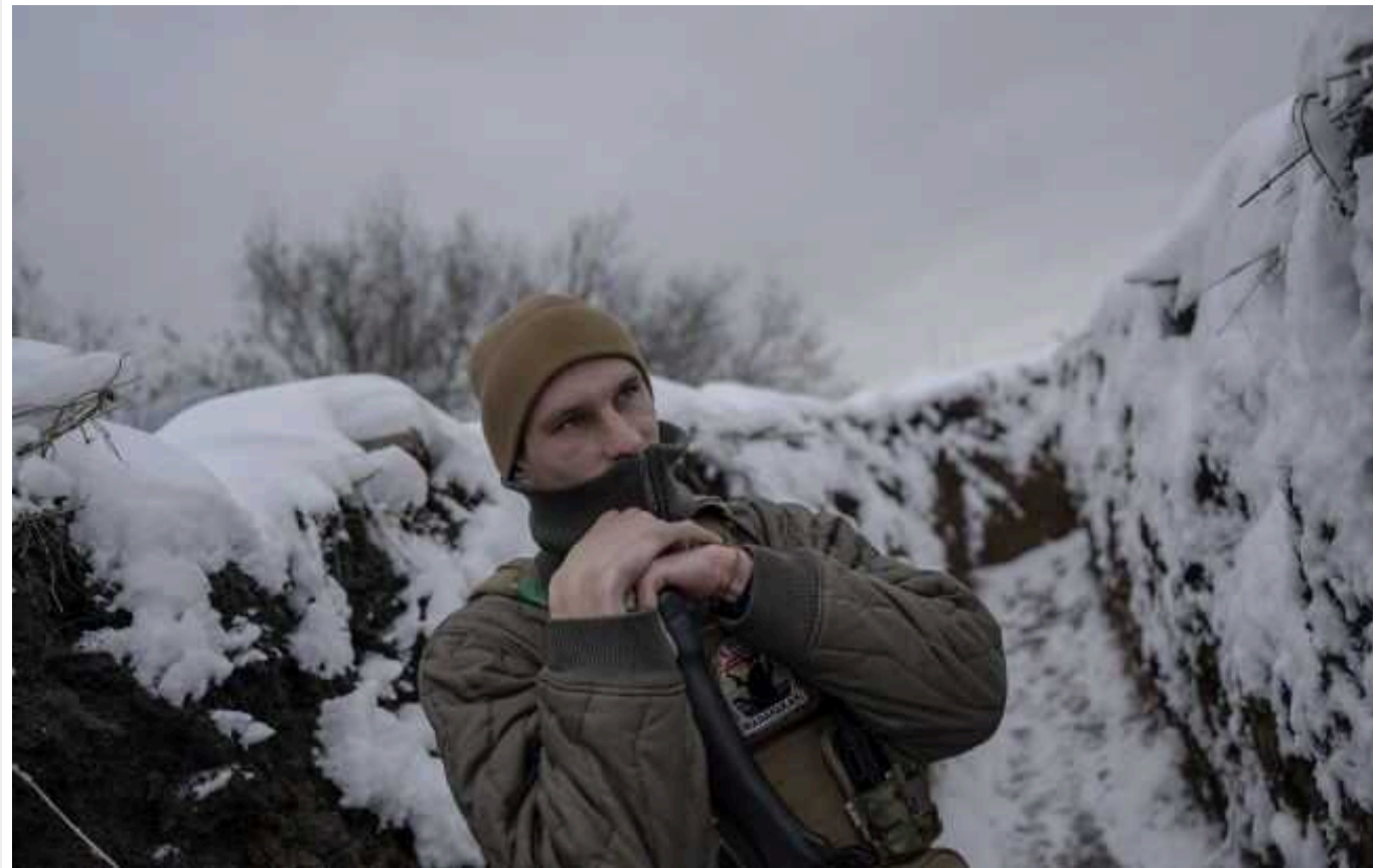
Хочуть забезпечити позиції під Куп'янськом: ЗСУ відбивають атаки на Синьківку, – Сирський

За словами командувача сухопутних військ України, ЗС РФ роблять ставку на чисельність особового складу. У зведенні Генштабу повідомляється про кілька атак протягом дня на село під Куп'янськом.