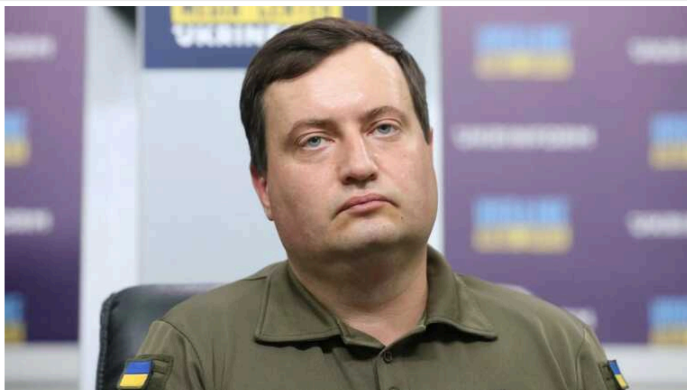
"Хороший масив": 100 ГБ даних про ВПК РФ використають для оборони України, — ГУР