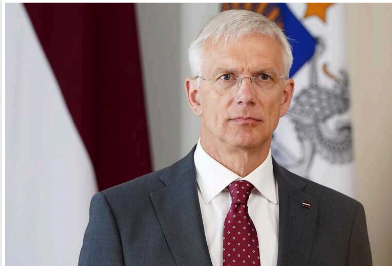
Посада генсека НАТО має дістатись країні, яка справно платить за оборону, - глава МЗС Латвії Каріньш

Найвища посада в НАТО має дістатися країні, яка справно платить за оборону.