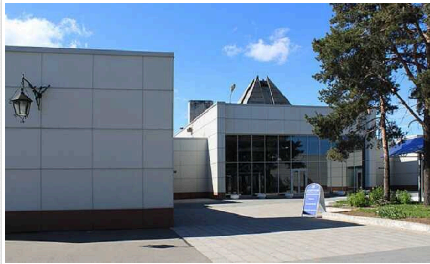
Через санкції проти РФ крематорій Санкт-Петербурга стикнувся з проблемами

Санкт-Петербурзький крематорій у Росії перестав приймати труни з бюджетних матеріалів. Це може бути з антиросійськими санкціями.