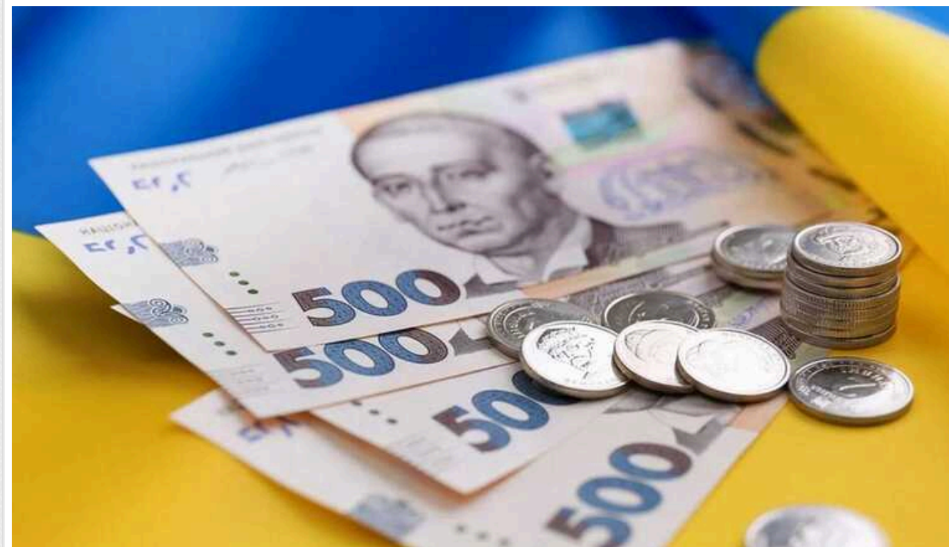
Кабмін продовжить виплати на проживання окремим категоріям внутрішньо переміщених осіб

Кабінет міністрів України планує продовжити виплату допомоги на проживання переселенцям, проте йдеться лише про окремі категорії внутрішньо переміщених осіб.