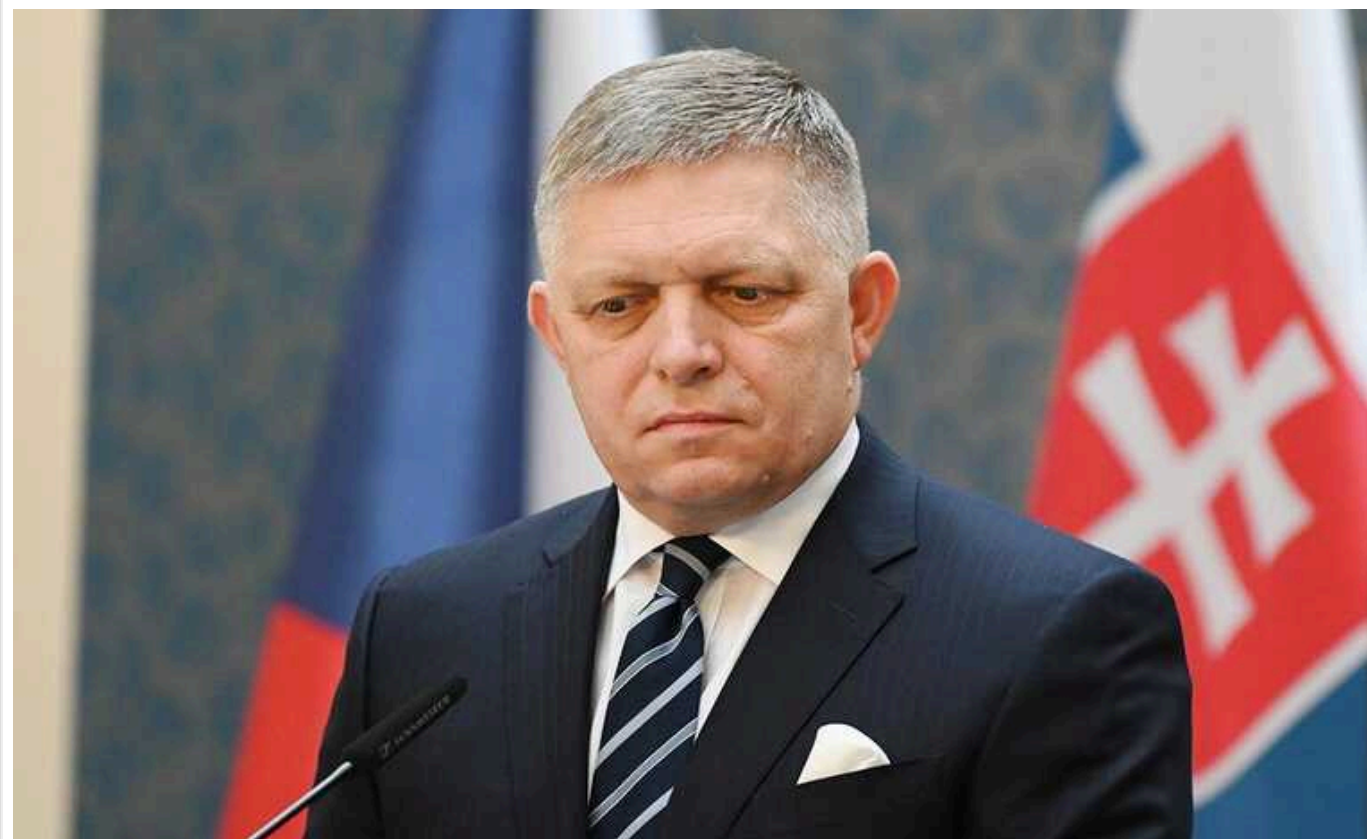
Прем'єр Словаччини Фіцо забажав покращення відносин із Москвою та "гарантій безпеки" для РФ: український дипломат Кастрян поставив його на місце

Прем'єр-міністр Словаччини Роберт Фіцо заговорив про необхідність "гарантій безпеки" для Росії, яка, за його словами, розпочала повномасштабне вторгнення "відреагувавши на ситуацію з безпекою й тиск України щодо вступу до НАТО". Посол України у Словаччині Мирослав Кастрян відповів, що Київ жодним чином не провокуює Москву, а Братислава свого часу (у березні 2004 року) також приєдналася до альянсу.