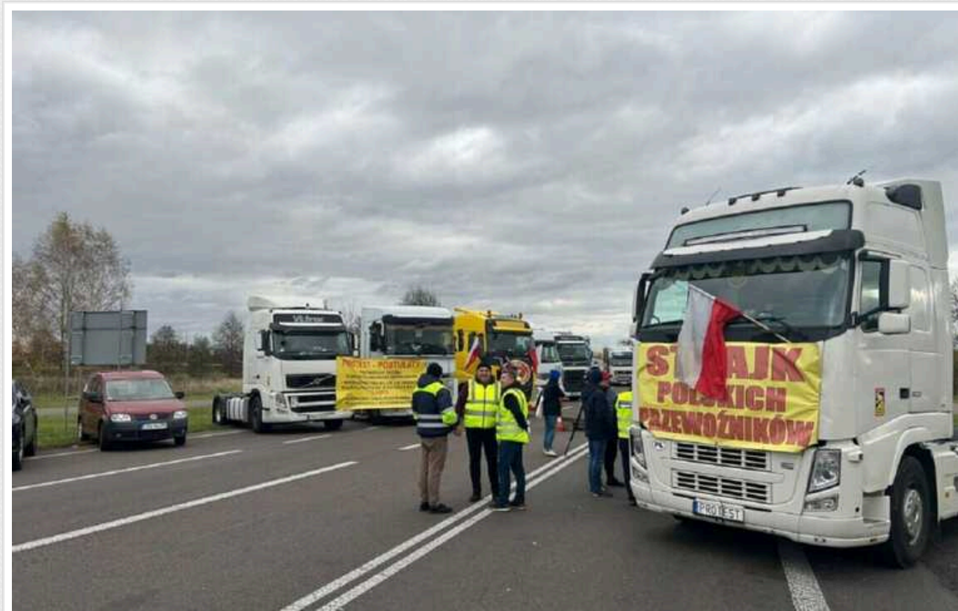
У Польщі місцева влада заборонила нову блокаду на кордоні України

Місцева влада в польській Медиці не видала перевізникам дозвіл на страйк. Протестувальники збиралися заблокувати рух вантажівок через пункт пропуску "Медика – Шегині" з 15 січня по 15 березня. Оскільки фермери вже припинили свій страйк на цьому КПП, поки що він залишиться відкритим для фур.