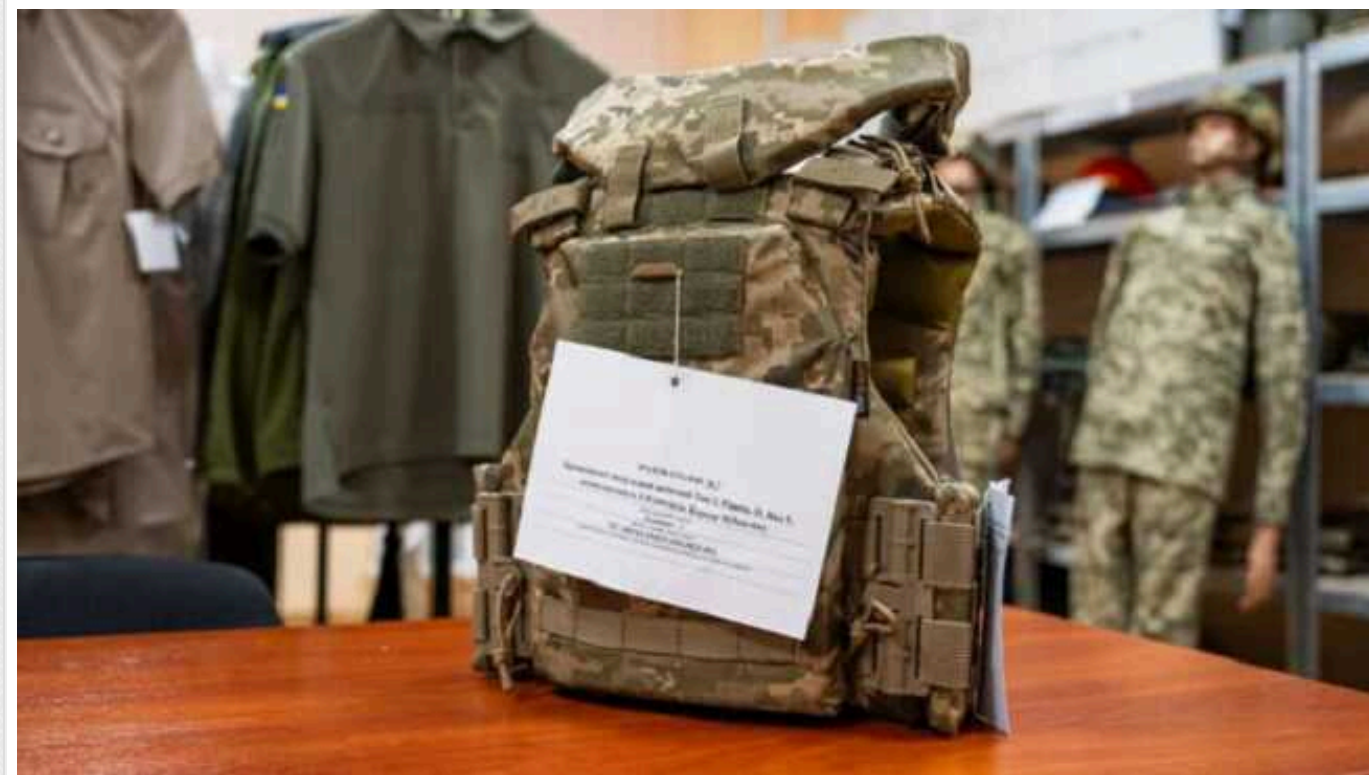
Міноборони сертифікувало другий бронезилет для жінок-військових

Міністерство оборони України затвердило другий зразок бронезилету для жінок-військовослужбовців. Його розробили у компанії Темп-3000.