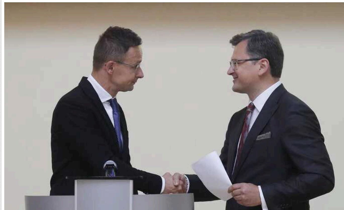
МЗС підтвердило, що 29 січня в Ужгороді відбудеться зустріч Кулеби з Сійярто

Олег Ніколенко підтвердив, що 29 січня в Ужгороді відбудеться зустріч міністра закордонних справ Кулеби із угорським колегою Петером Сійярто.