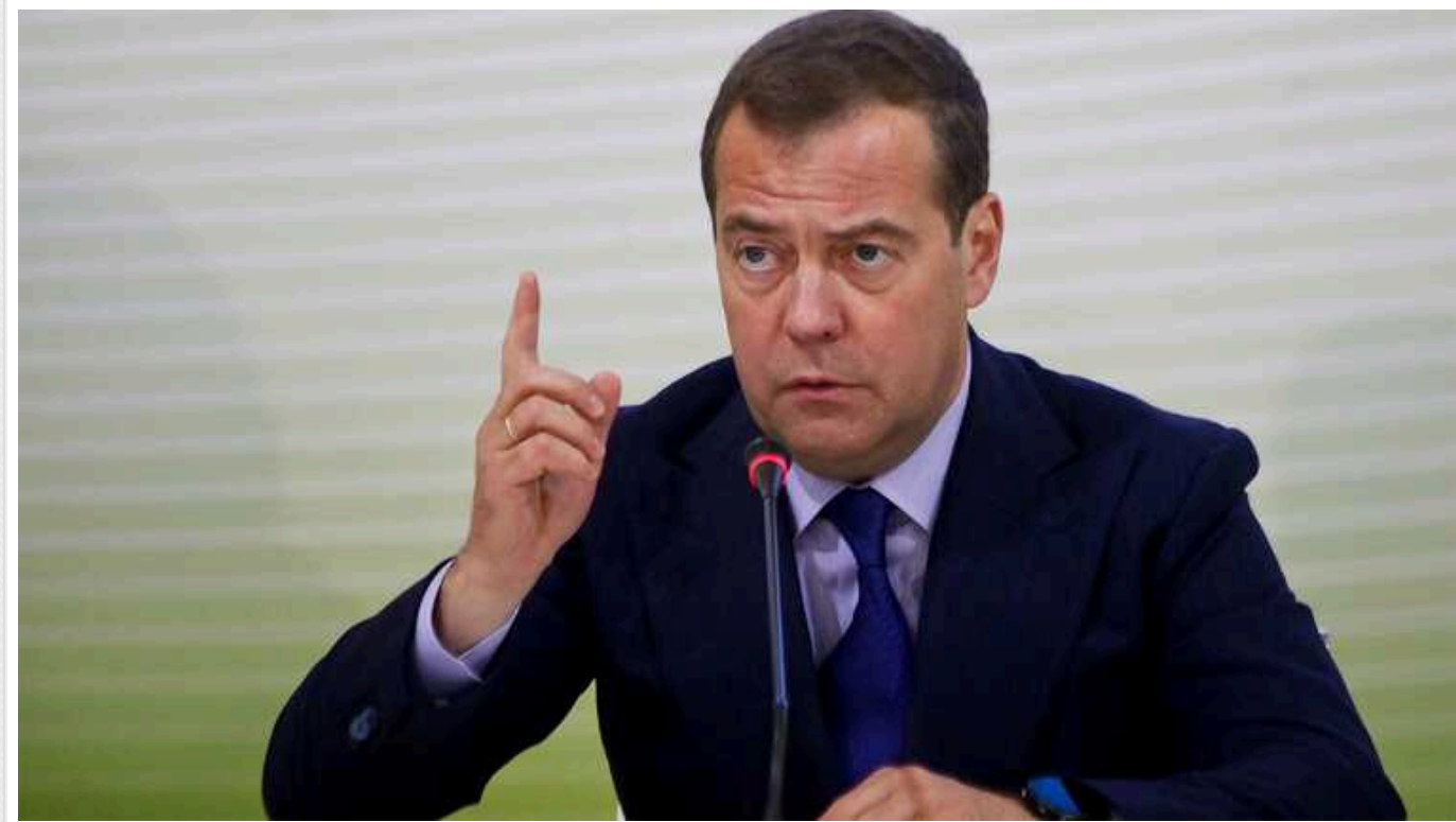
Медведєв пригрозив ядерною зброєю у відповідь на удари ракетами по РФ: "Ризикують нарватися"

Колишній президент РФ Дмитро Медведєв заявив, що не називає удари далекобійною західною зброєю по території РФ категорією самооборони. Це нібито пряма підстава для використання ядерної зброї.