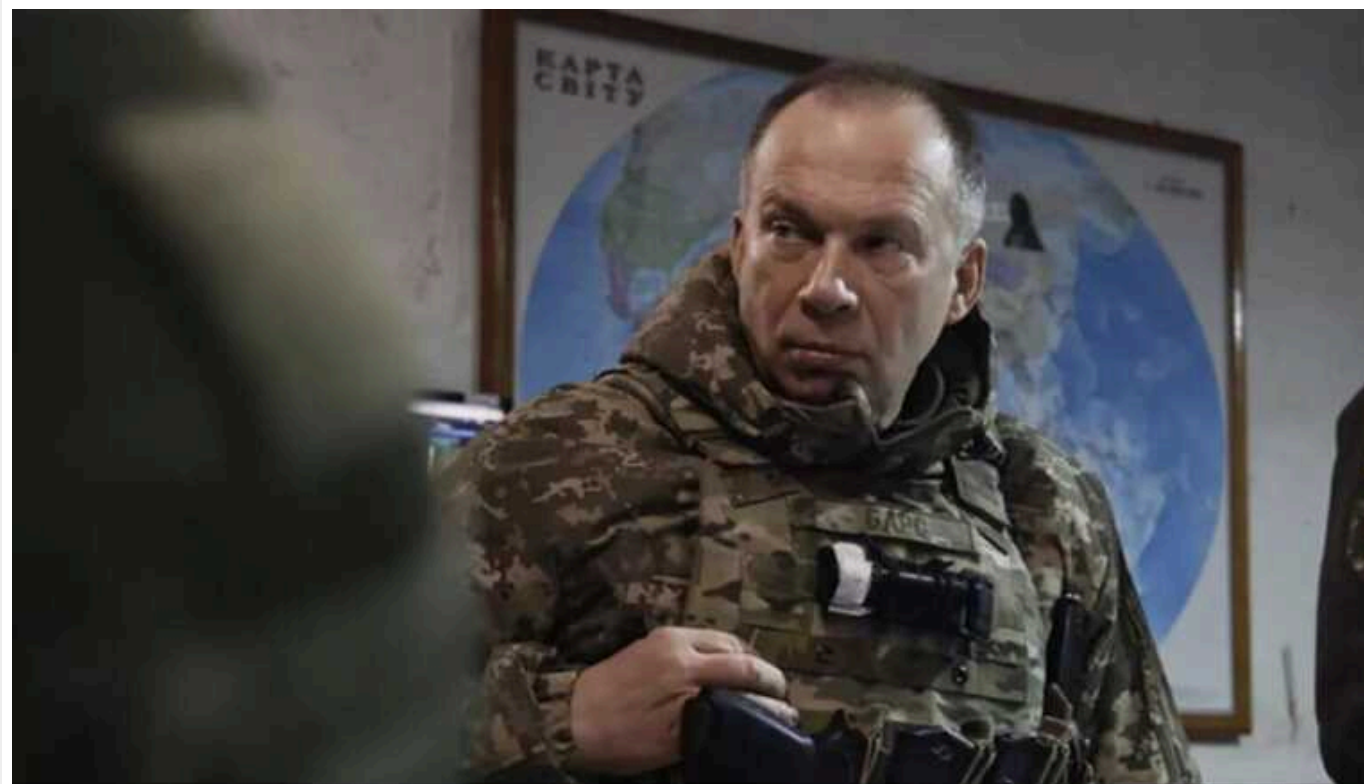
Окупанти готуються до наступу на Сіверському напрямку та під Бахмутом, – Сирський

Оперативна ситуація на сході України залишається складною – росіяни продовжують атакувати позиції воїнів Сил оборони на Куп'янському, Лиманському та Бахмутському напрямках.