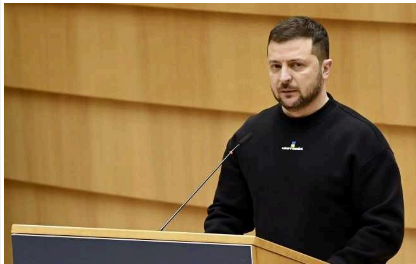
Зеленський в Естонії закликав до конфіскації активів РФ: "Росія повинна заплатити повну ціну за цю агресію"

Президент України Володимир Зеленський під час візиту до Талліна заявив, що активи країни-агресорки РФ мають бути виявлені, заморожені та зрештою конфісковані. Він наголосив, що Москва має заплатити повну ціну за злочини проти українців.