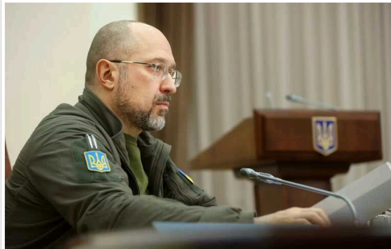
НАЗК склало протокол на Шмигала: прем'єру загрожує штраф із усуненням

Голова Національного агентства із запобігання корупції Олександр Новіков склав адміністративний протокол щодо прем'єр-міністра України Дениса Шмигала.