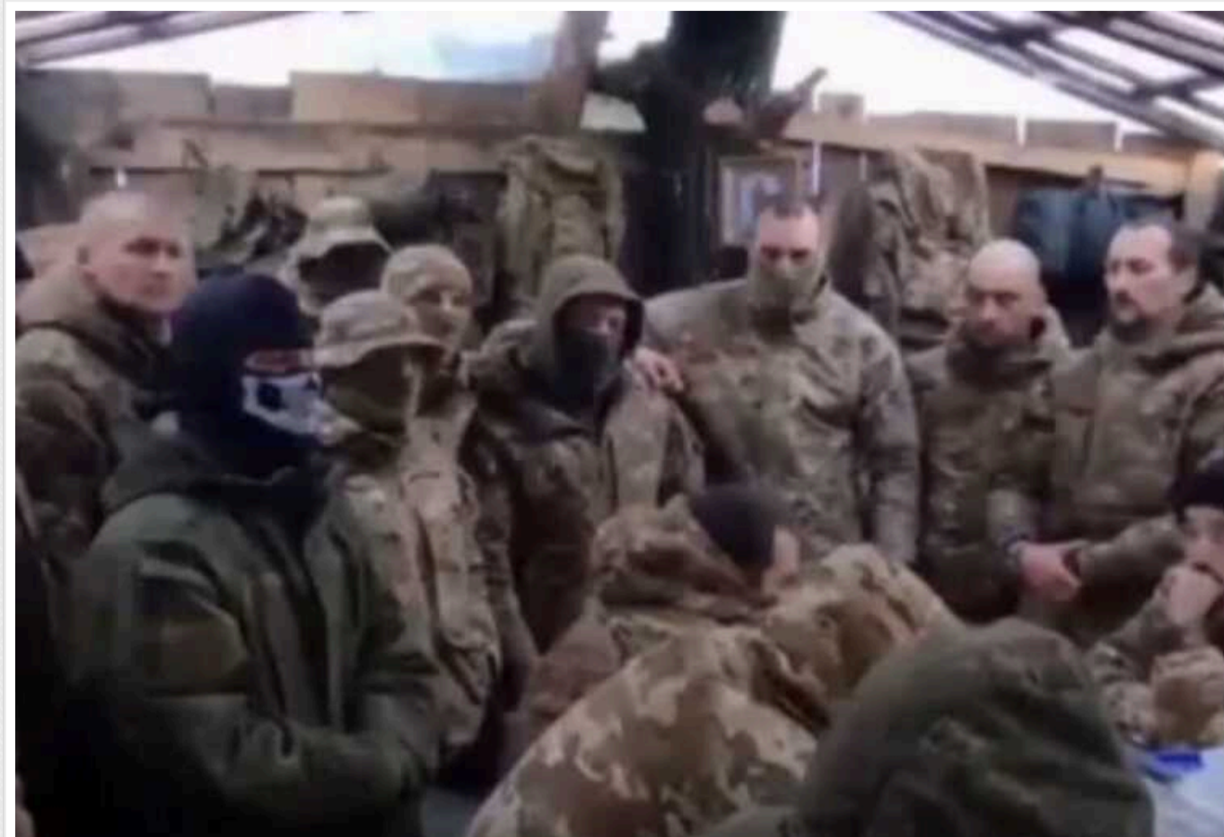
Сербські найманці збунтувалися через "утиски" і записали жалісливе звернення до Путіна

Сербські найманці, які у складі російської окупаційної армії воюють проти України, поскаржилися диктатору Володимиру Путіну на скотське ставлення з боку російського командування. Бойовики розповіли про погане ставлення офіцерів 119-го парашутно-десантного полку ЗС РФ та попросили перевести їх до іншого відділення.