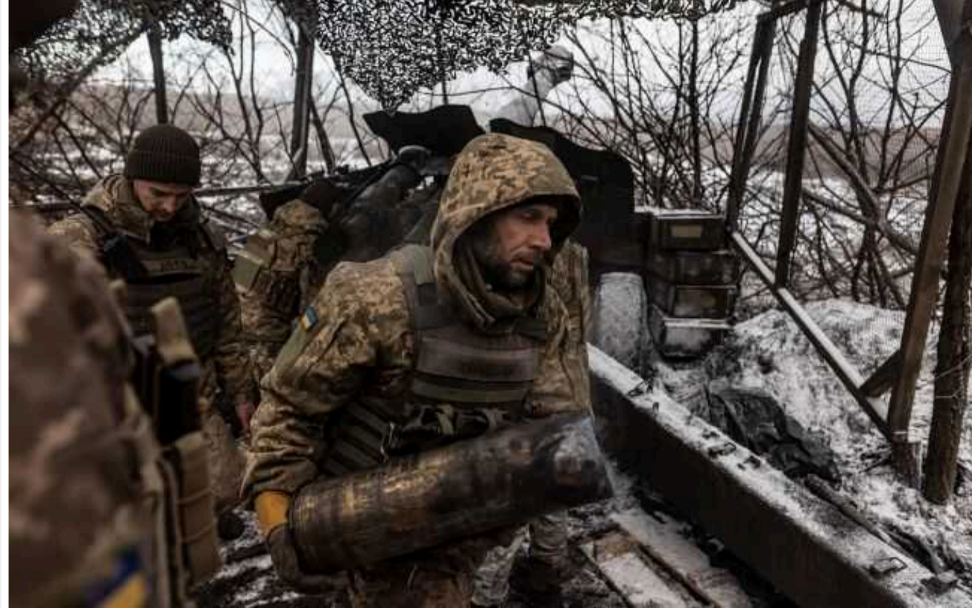
Ситуація на фронті на Харківщині: українські військові влаштували ворогам другу "Чорнобаївку"

Війська РФ продовжують наступати на Куп'янському напрямку, що у Харківській області. Попри свої чисельні спроби, ворог зазнає значних втрат у техніці та особовому складі.