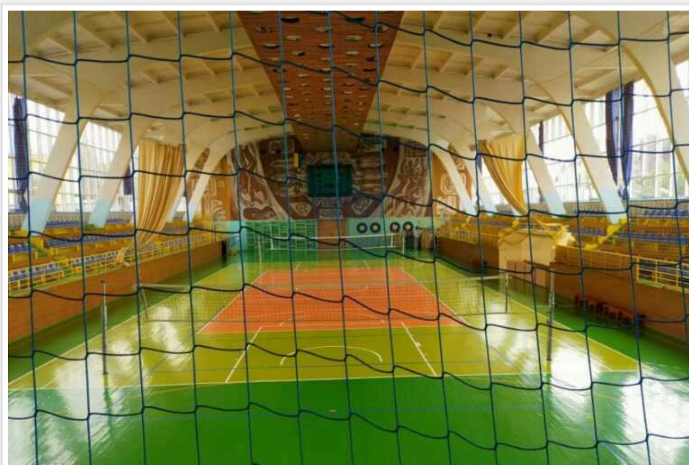
У Києві школа спорту на Дарниці провела тендер на ремонт приміщення за завищеними удвічі цінами

Комплексна дитячо-юнацька спортивна школа «Школа спорту» Київради 28 грудня за результатами тендеру замовила ТОВ «Будівельне підприємство «Буд-граніт» капітальний ремонт приміщень за 16,7 млн грн.