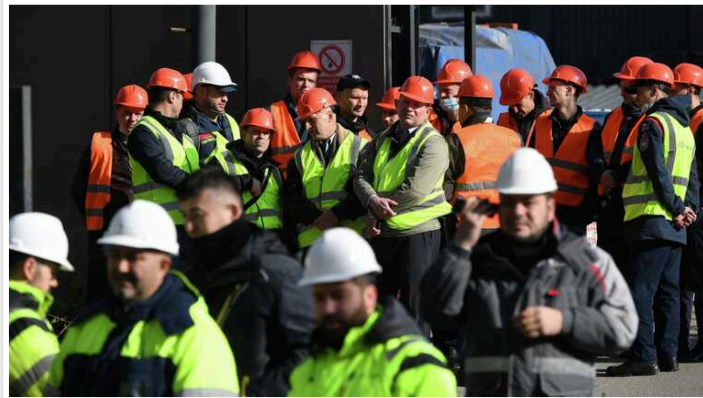
Через еміграцію та мобілізацію у РФ катастрофа з робітниками

Кількість незакрытих вакансій у Росії сьогодні обчислюється сотнями тисяч. На нестачу співробітників скаржаться дедалі більше підприємств і компаній різних галузей. Наразі в Росії вже не вистачає приблизно 4,8 млн працівників, і з кожним роком ситуація буде погіршуватися.