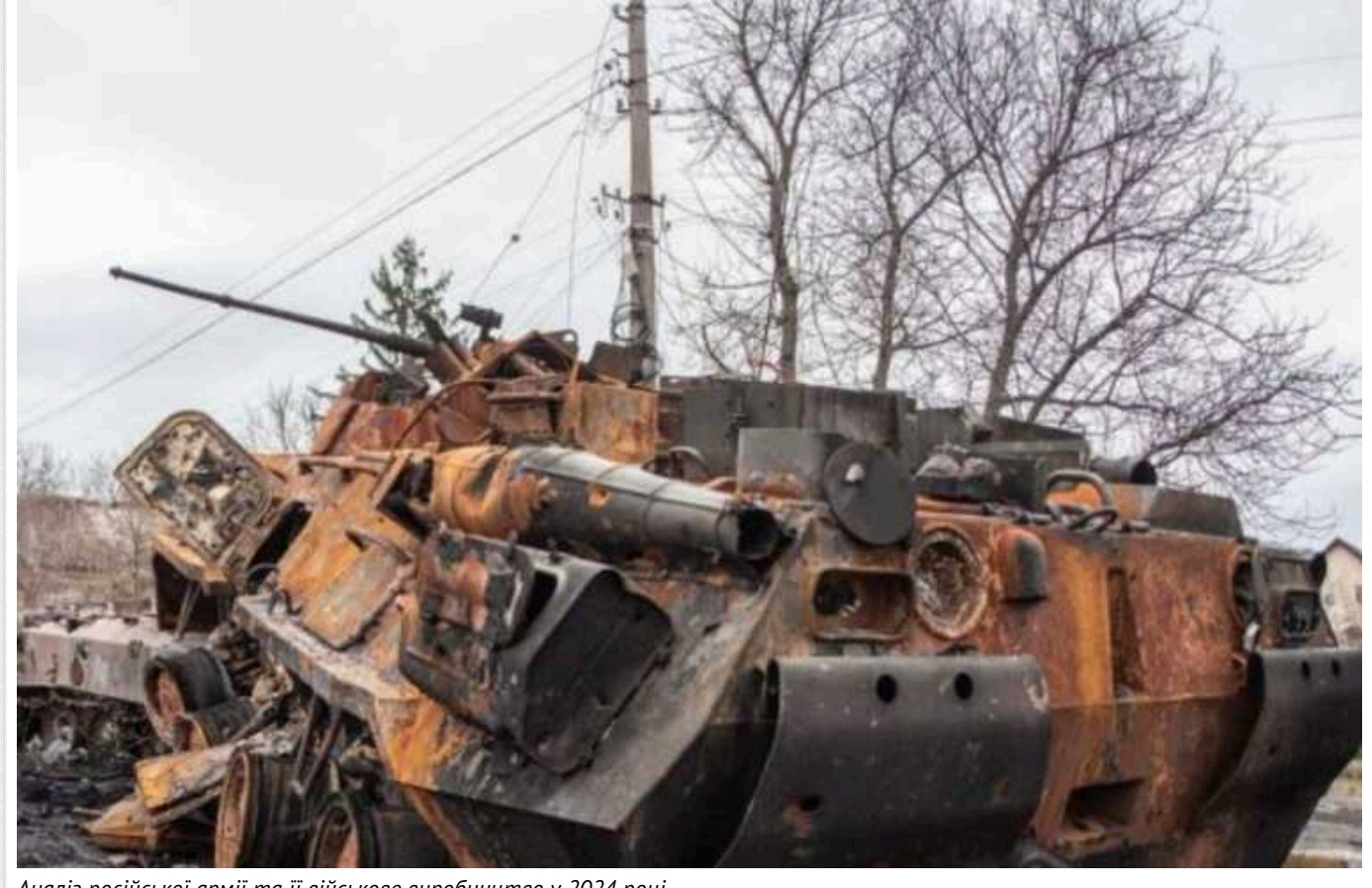
Аналіз російської армії та її військове виробництво у 2024 році