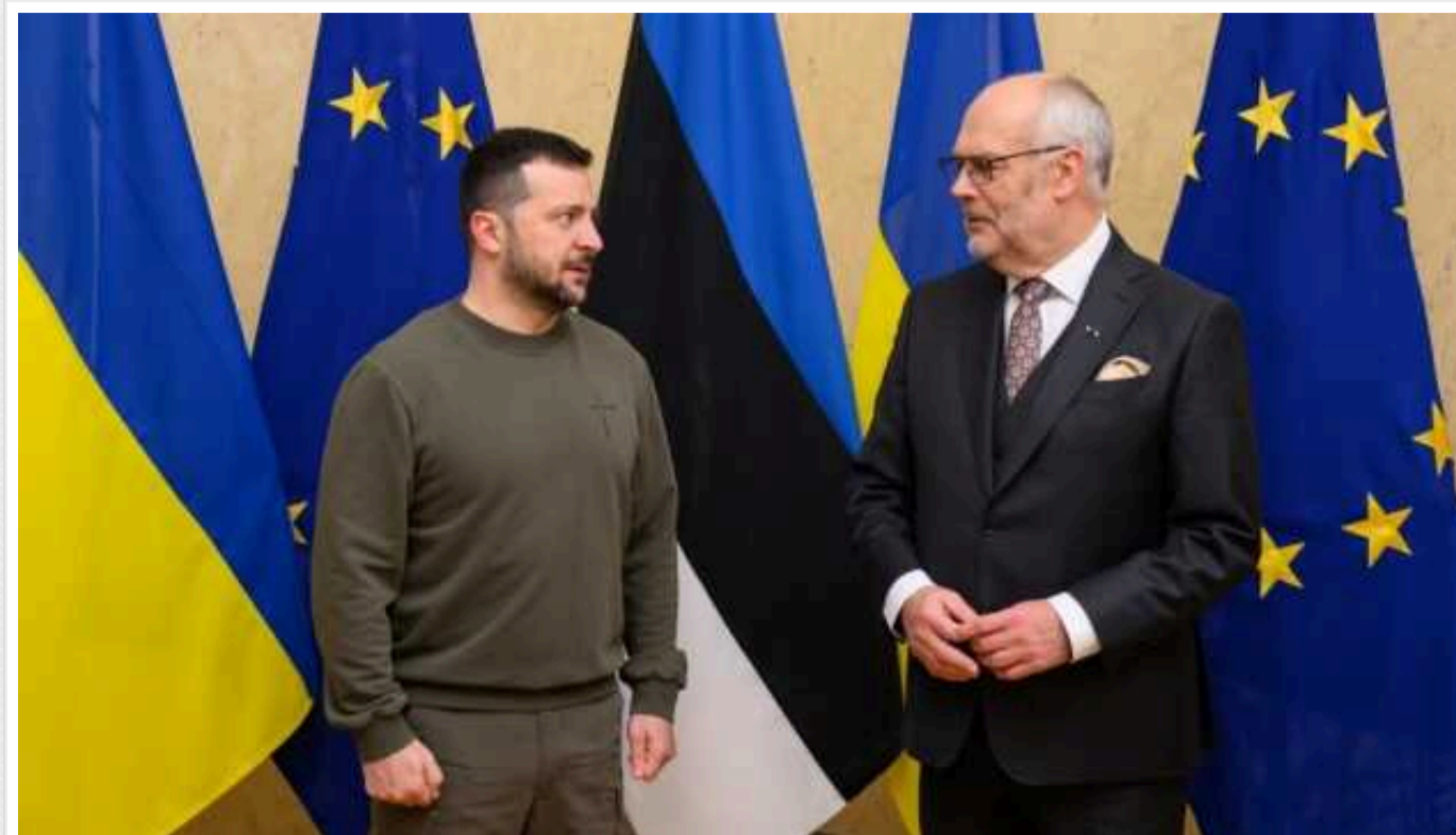
Естонія до 2027 року надасть Україні допомогу на 1,2 млрд євро

Президент Алар Каріс оголосив, що Естонія виділить Україні допомогу в розмірі 1,2 млрд євро до 2027 року.