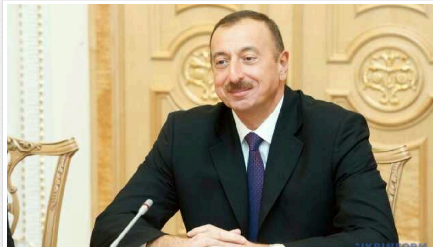
Президент Азербайджану заявив, що основні умови для мирного договору з Вірменією вже створені

Президент Азербайджану Ільхам Алієв заявив, що вже створені основні умови для підписання мирного договору з Вірменією.