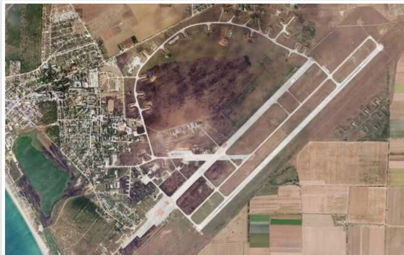
З'явилися супутникові знімки наслідків одного з недавніх ударів ЗСУ по Криму

У Мережі опублікували супутниковий знімок нещодавнього удару Збройних сил України по об'єкту у тимчасово окупованому Криму. На ньому видно ураження, які українські сили, ймовірно, завдали ворогові напочатку січня.