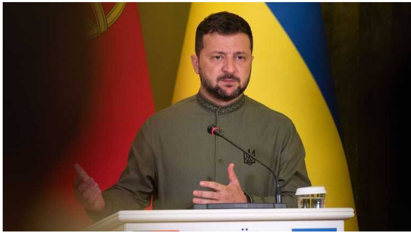
Зеленський пояснив, чому пауза у війні піде на користь лише Росії, а не Україні

Паузи у війні не буде. Якщо Росії дати паузу, вона піде на користь тільки їй, але ніяк не Україні.