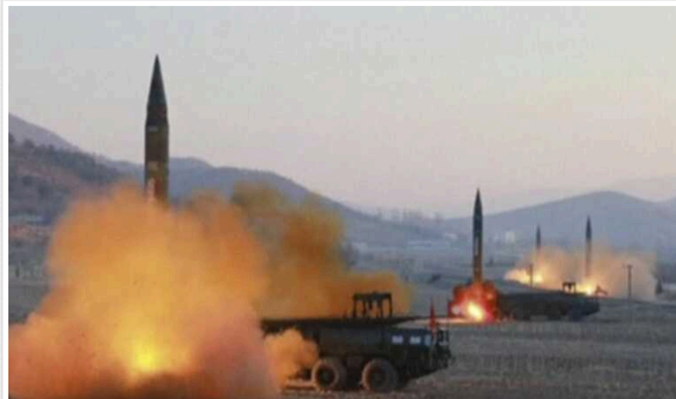
КНДР може бути готова продати РФ новий тип балістичних ракет із дальністю до 180 кілометрів

Міністр оборони Південної Кореї Шин Вон Сік сказав, що Північна Корея надала Росії близько 5000 контейнерів зі зброєю, які можуть вмістити близько 2,3 млн артилерійських снарядів 152-мм або близько 400 000 боеприпасів 122-мм.