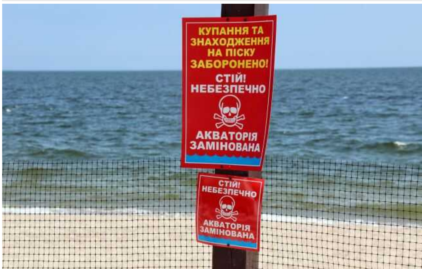
Болгарія, Румунія та Туреччина створюють коаліцію для пошуку мін у Чорному морі

Країни-члени НАТО Туреччина, Румунія та Болгарія об'єднали зусилля для пошуку мін у Чорному морі. Цей крок був спрямований на підвищення безпеки судноплавства та на підтримку життєво важливого експорту українського зерна.