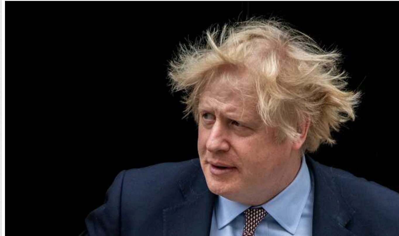
Експрем'єр Великої Британії Джонсон підтвердив, що відмовляв Україну від мирної угоди з РФ

Експрем'єр Великої Британії Борис Джонсон фактично підтвердив інформацію про те, що вплинув на рішення української влади відмовитись від мирної угоди з Москвою навесні 2022 року.