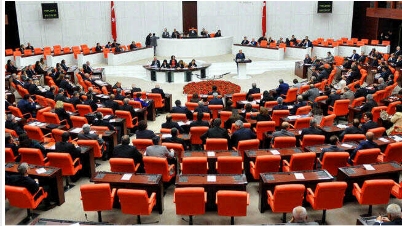
У Туреччині найближчими тижнями парламент може обговорити членство Швеції в НАТО

Голова парламентської групи правлячої партії Туреччини Абдулла Гюлер сказав, що депутати можуть розглянути заявку Швеції на вступ до НАТО найближчими тижнями.