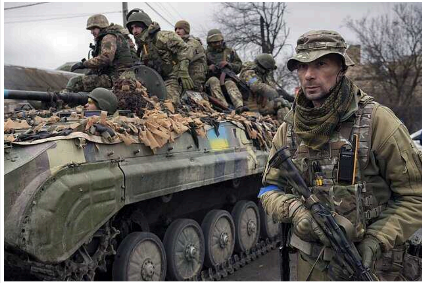
Сили оборони за добу ліквідували 830 окупантів і 12 танків

Мінус 830 солдатів, 22 БМ, 15 артилерійських систем і 12 танків – такими є втрати Росії у війні проти України за минулу добу.