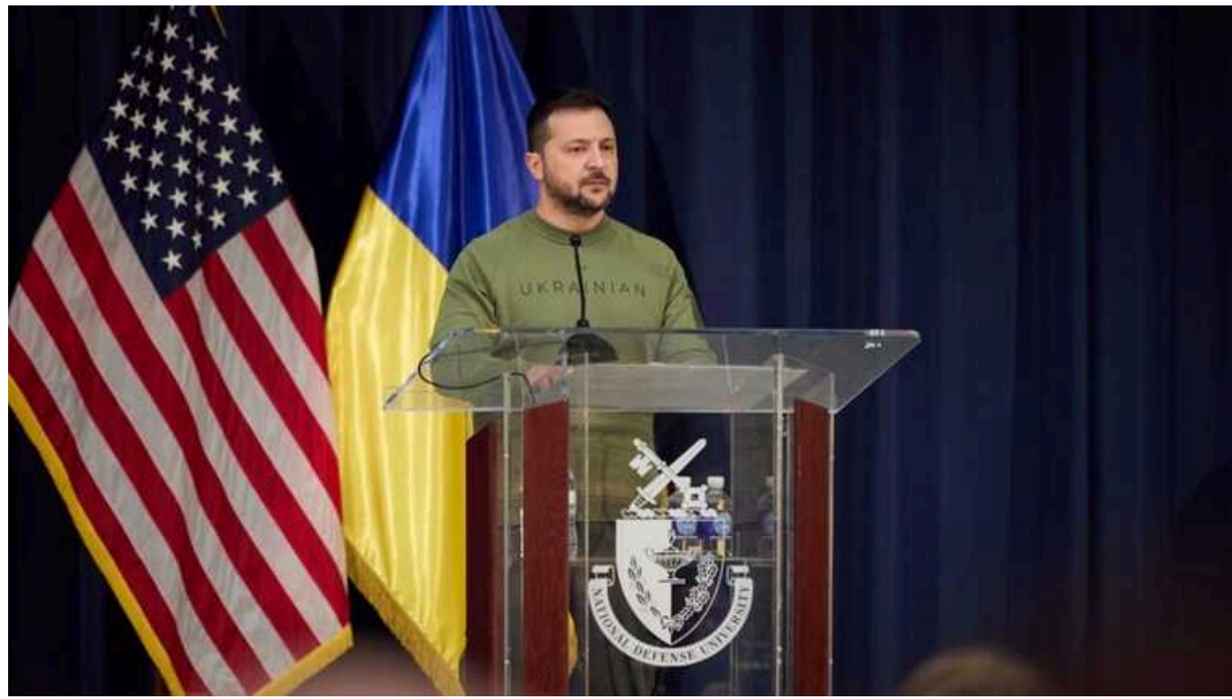
США хочуть від Зеленського чіткого плану ведення війни, – ЗМІ

США хочуть, щоб Україна вдосконалила свій план ведення війни проти РФ і, як очікується, піднімуть це питання з президентом Володимиром Зеленським у швейцарському Давосі наступного тижня.