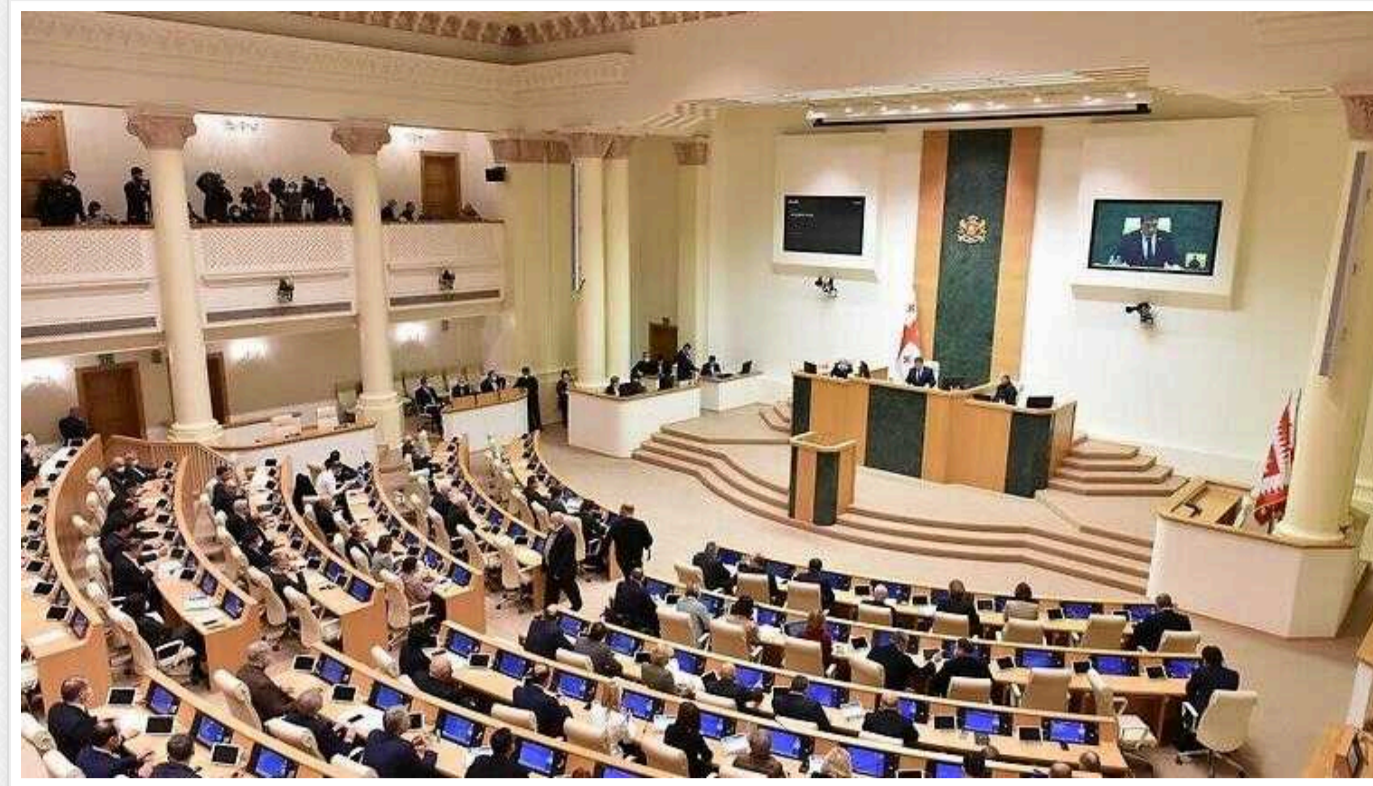
У Грузії вперше призначили парламентські вибори за пропорційною системою

Центральна виборча комісія Грузії оголосила, що чергові парламентські вибори відбудуться 26 жовтня 2024 року.