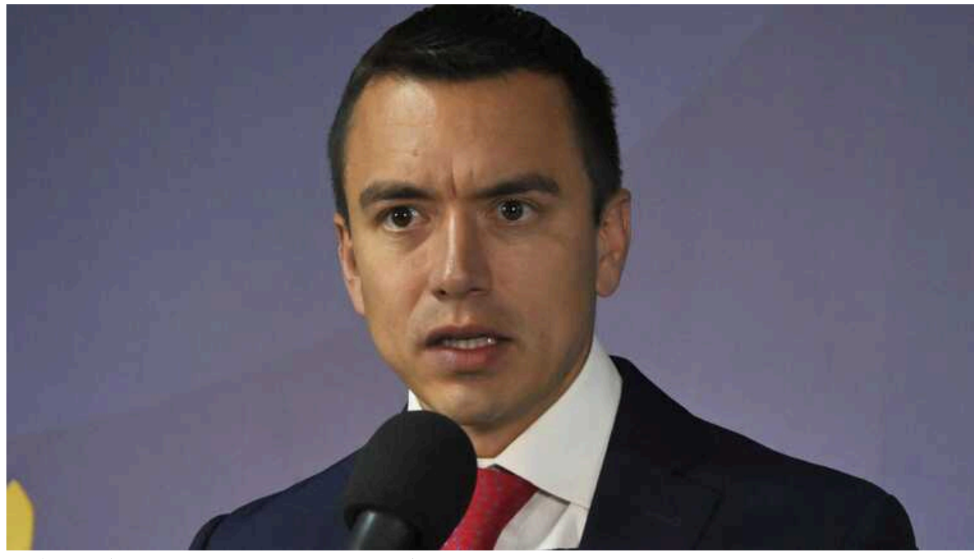
Еквадор перебуває у стані війни з терористами, – Нобoa

Еквадор оголосив війну внутрішнім терористам, якими вважає кримінальні угруповання, пов'язані з наркотрафіком.