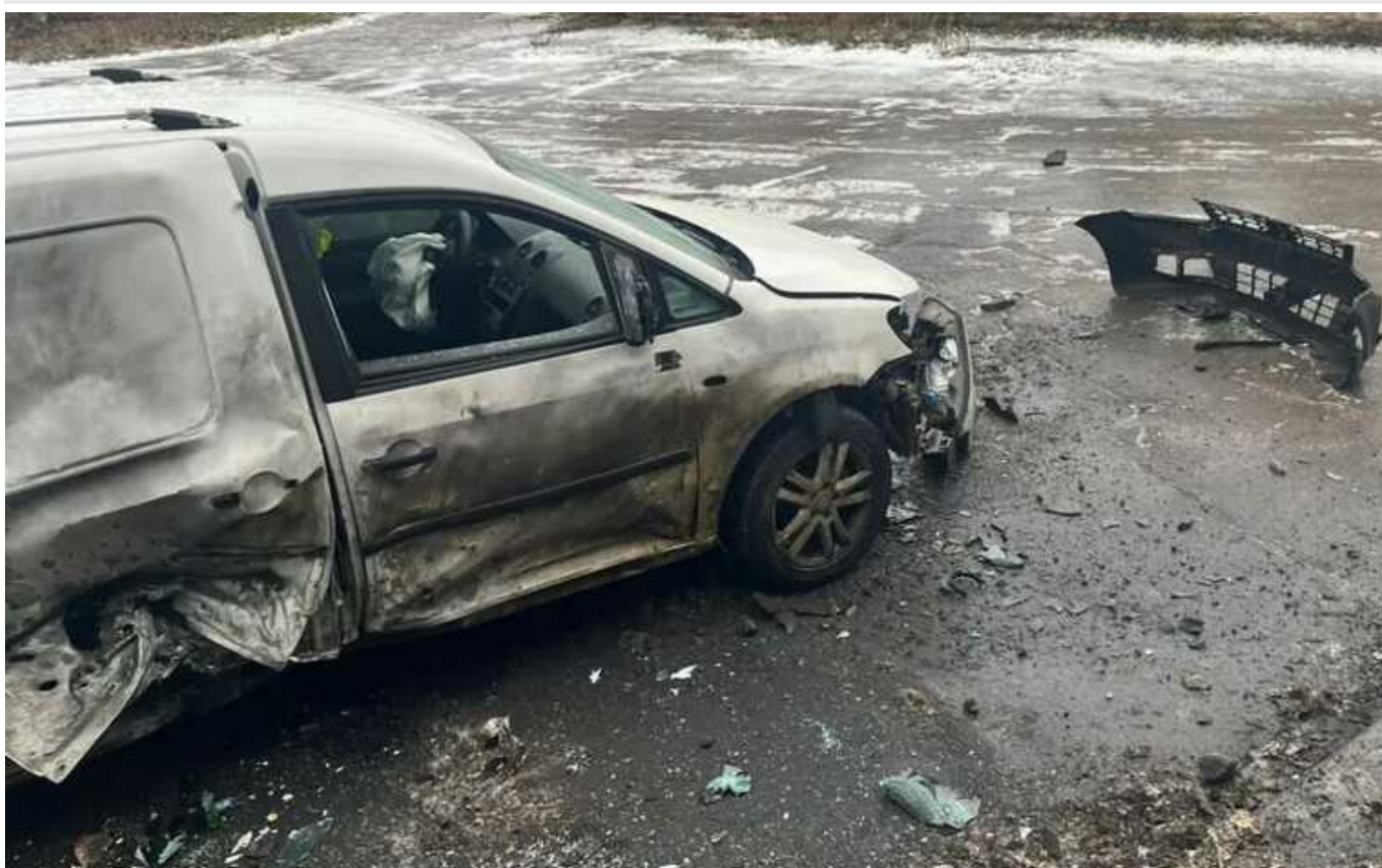
Армія РФ надвечір обстріляла Дніпропетровщину: у Нікополі постраждало двоє мирних жителів

Окупаційні російські війська ввечері в середу, 10 січня, атакували Дніпропетровську область. Нікопольський район загарбники обстріляли артилерією та атакували ударними безпілотниками, а в Синельниківському районі українські військові знищили ракету.