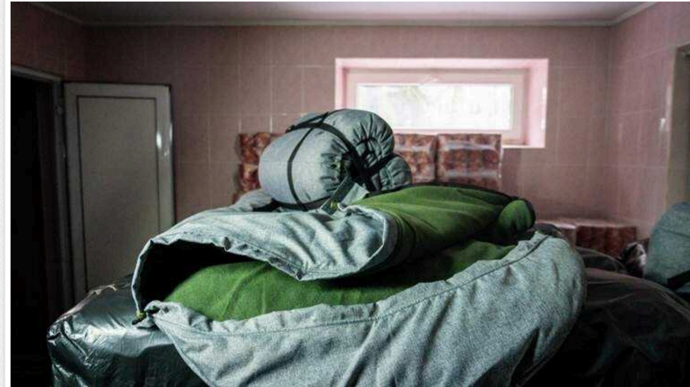
Тернопільська міськрада закупила спальники на 12 мільйонів гривень у фірми, створеної за 5 днів до тендера

Міська рада Тернополя у 2022 році закупила спальники на 12 млн 690 тис. гривень у підприємства, яке створили за 5 днів до проведення тендера. 4500 спальних мішків мерія придбала на випадок блекауту. Під час закупівлі працівники Західного офісу Держаудитслужби також виявили й інші порушення та звернулися до міської ради з вимогою їх виправити. Мерія оскаржила це в суді, однак після року розгляду справи суд таки постановив задовільнити вимоги аудиторів.