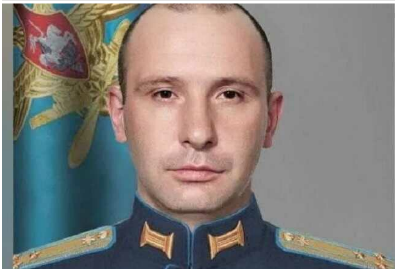
Під час удару по Севастополю ЗСУ ліквідували полковника армії РФ Ісмагілова

Внаслідок атаки 4 січня по закритому командному пункту російських військ під Севастополем (тимчасово окупований Крим) загарбники зазнали втрат у живій силі. Серед ліквідованих – полковник ворожої армії Ісмагілов Вадим Наїльович.