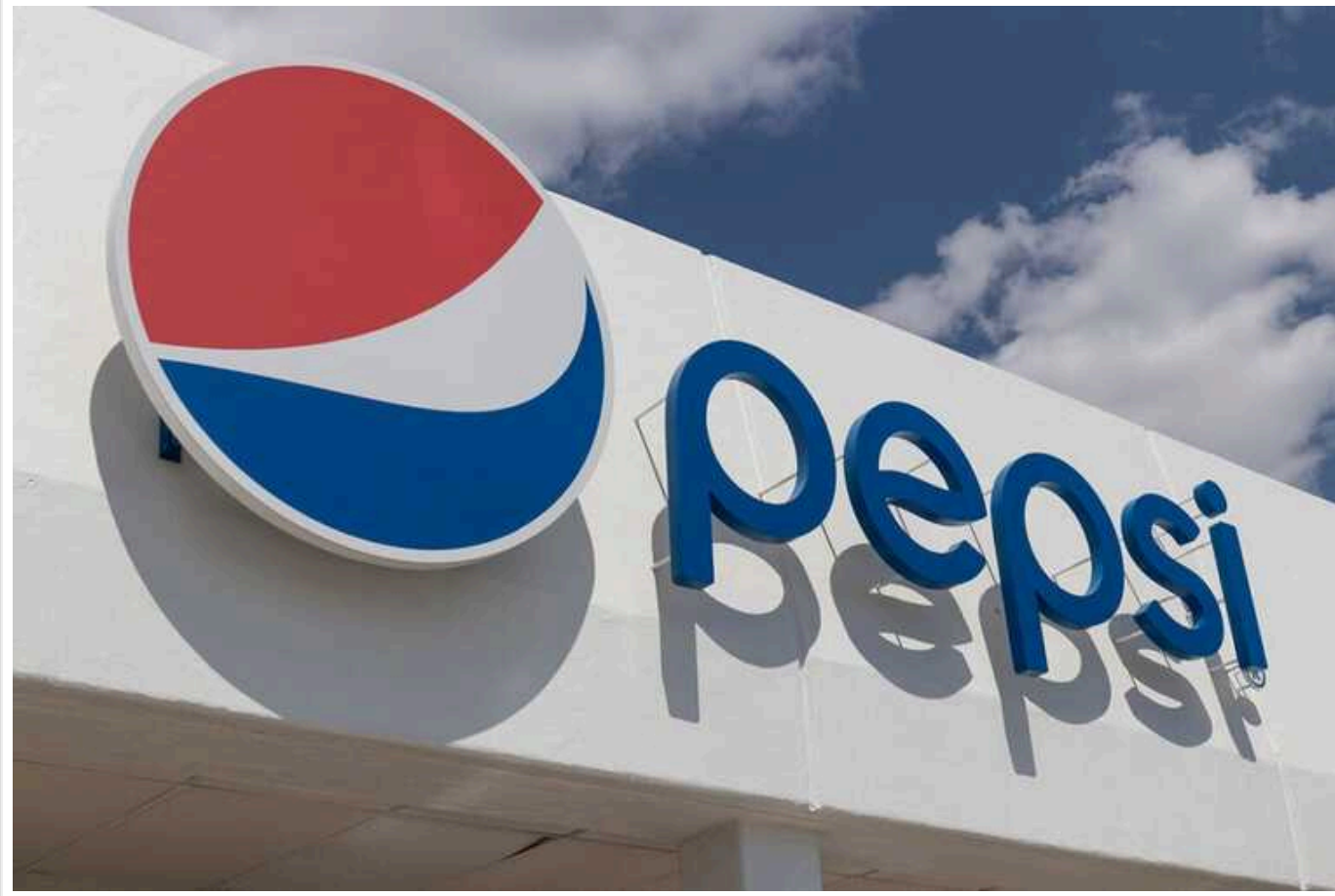
PepsiCo заборонив згадувати війну в Україні в рекламі

Внесена до списку міжнародних спонсорів війни американська компанія PepsiCo (бренди Lay's, Mirinda, Pepsi, Sandora, 7up, "Чудо", "Слов'яночка", "Садочок", "Сандорик" та ін.) забороняє згадувати про російську агресію у своїй рекламі. Причому, в самій Україні.