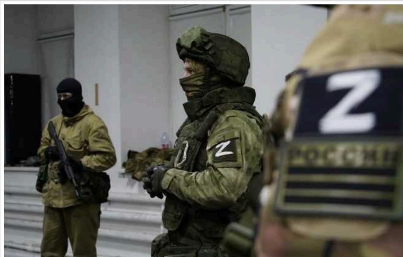
Терор російських окупантів в Україні перейшов на новий рівень

На захопленні українських територіях російські окупанти сьогодні почувуються господарями. Але ось у Запорізькій області, за твердження місцевих жителів, ародують як в останній день, а віднедавна це й посилити терор.