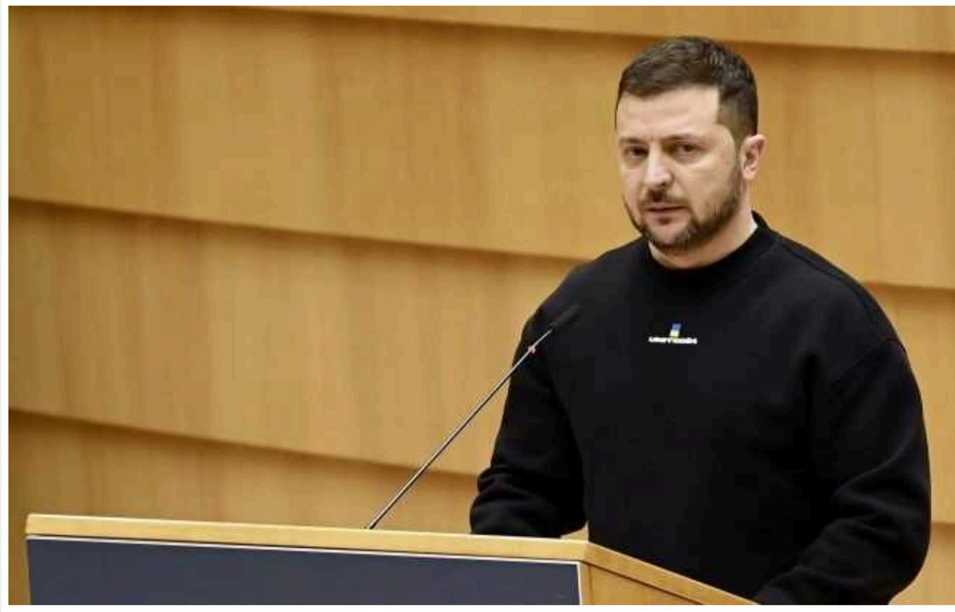
Зеленський заповідає, що тиску від партнерів щодо припинення захисту немає

Тиску від партнерів щодо припинення захисту України поки що немає. Союзники поки не готові офіційно дати відповідні сигнали.