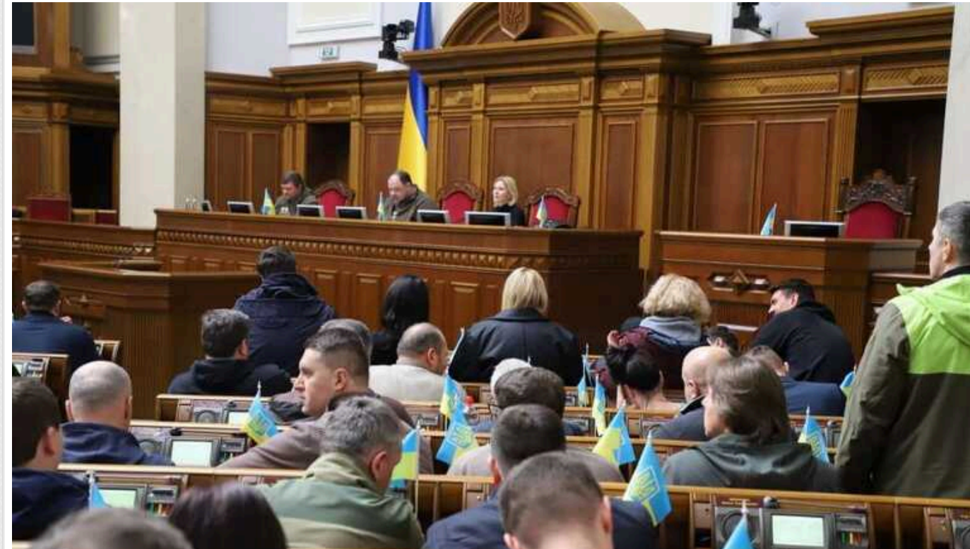
ВР ухвалила в першому читанні законопроект про лобіювання, на який чекали у Євросоюзі

Ухвалення законопроекту про лобізм є фактично останньою з вимог Єврокомісії, сформульованою у звіті про розширення у листопаді. Тому Рада схвалила цей проект закону.