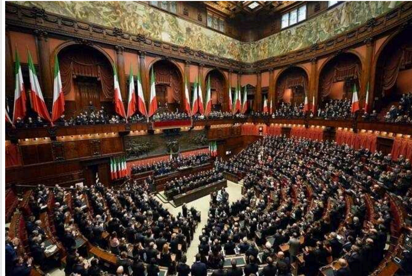
Нижня палата парламенту Італії підтримала продовження військової підтримки України

Нижня палата парламенту Італії підтримала резолюцію щодо продовження військової підтримки України.