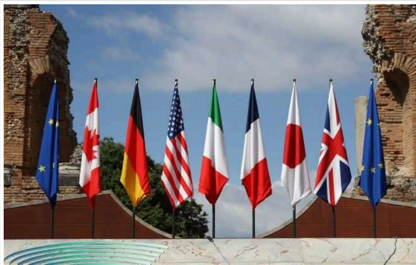
Євросоюз має плани передати Україні 15 мільярдів доларів доходів від заморожених активів РФ

Країни "Великої сімки" (G7) обмірковують, як використати близько 260 млрд євро, що належать російському центральному банку, на користь України. Водночас європейські країни роблять невеликі кроки до використання доходів від активів у розмірі 15 млрд євро.