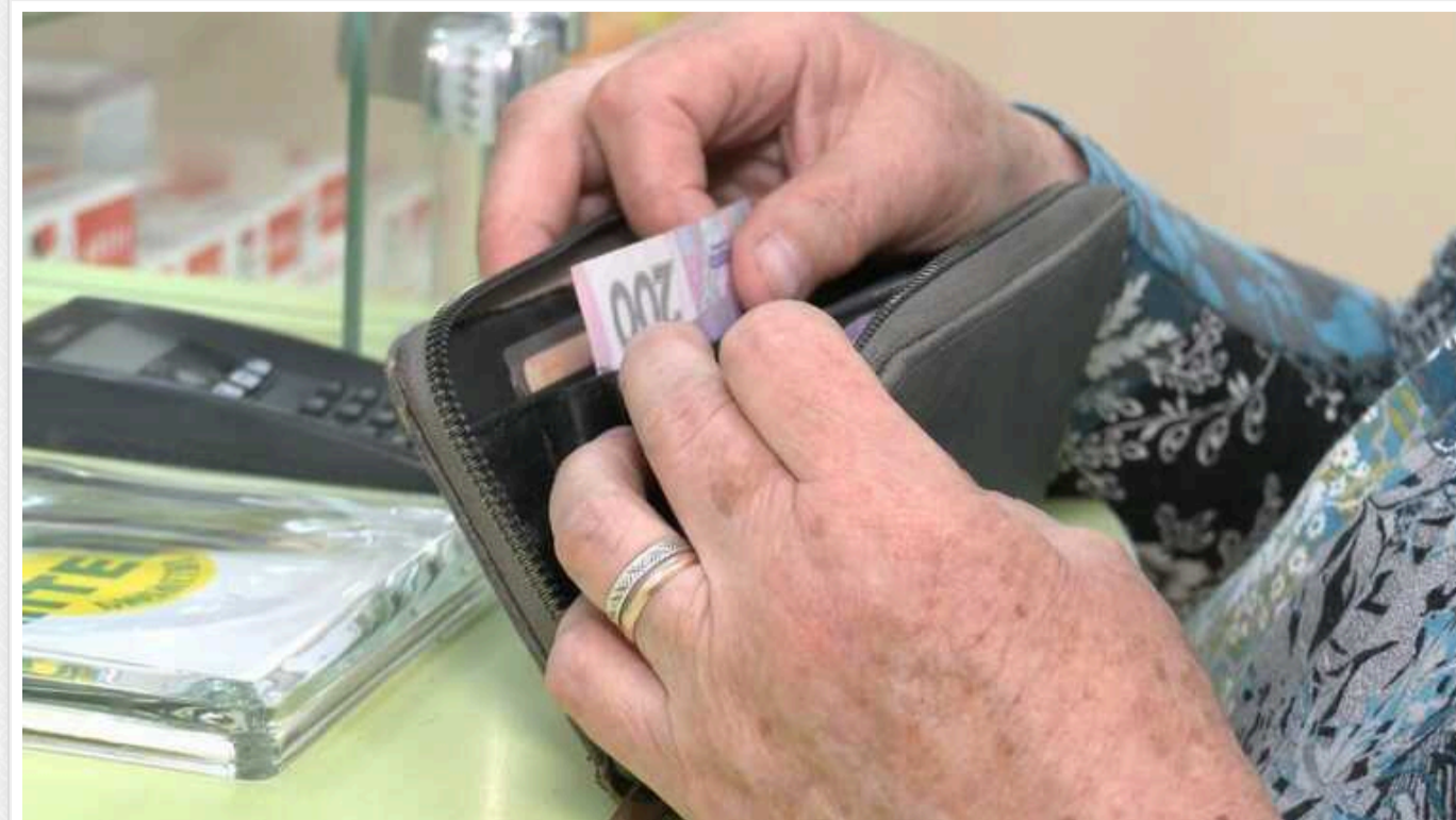
Понад 5 мільйонів українців отримують пенсію, яка не перевищує 100 євро

Станом на початок січня пенсії у понад 10 тис. грн отримували 1,15 млн українців, що становить лише 10,9% від загальної кількості пенсіонерів. Водночас пенсії менше 4000 гривень отримували понад 50% пенсіонерів.