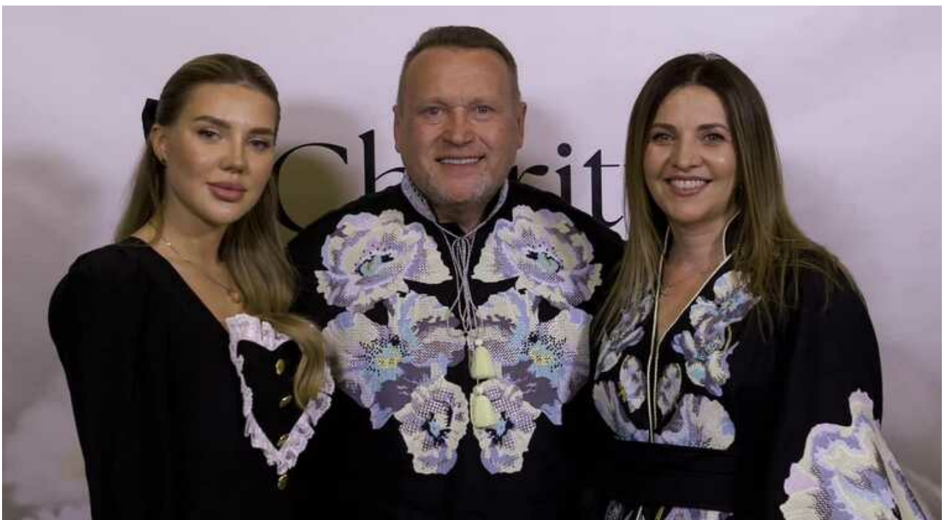
Нерозірвані контракти Гринкевичів і постачання гумових чобіт

Ось чому я не раділа вранішній новині про розірвання контрактів з компаніями Гринкевичів.