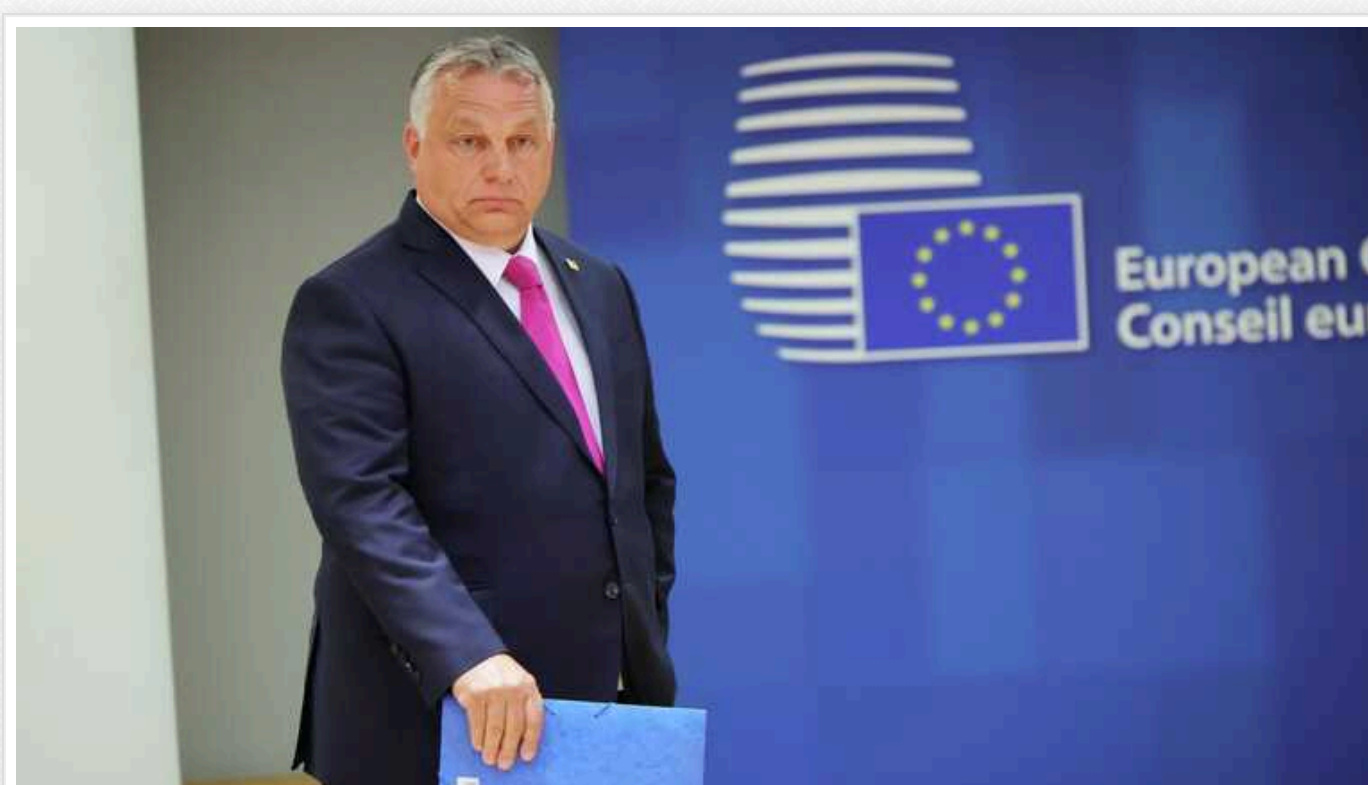
Наскільки високі шанси проросійського Орбана очолити Єврораду: "Налаштовуємось на півроку під угорським лідерством?"

Прем'єр-міністр Угорщини Віктор Орбан може очолити Європейську раду. Це стало можливим після того, як нинішній президент органу Шарль Мішель оголосив про рішення брати участь у виборах до Європарламенту : у разі успіху він залишить свою посаду вже у липні.